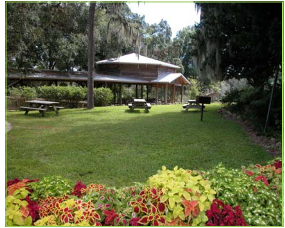
Ravine Gardens State Park

Los martes y algunos fines de semana selectos, varios parques ofrecerán entrada gratuita cuando mencione Twitter en el portón. Los días gratuitos se anuncian a las 8 a.m. en Twitter e incluirán parques en todo el estado. Siga Florida State Parks en Twitter, en www.twitter.com/FLStateParks , para obtener información sobre los días gratuitos exclusivos.